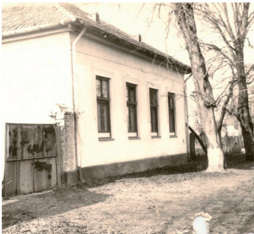
ȘCOALA MARGINA - 1912