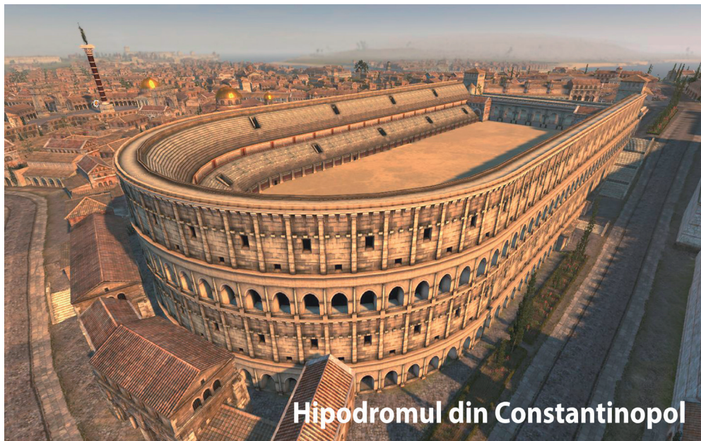
Hipodromul din Constantinopol

Benedict Aghioritul, trad. de Pr. Victor Manolache, Ed. Egumenița, Galați, 2012