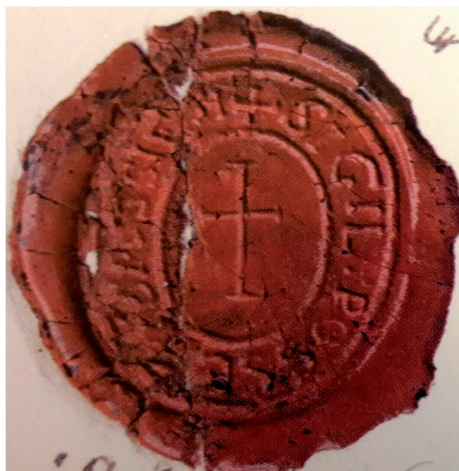
SIGILIU DIN 1803

Din punct de vedere administrativ, la sfârșitul secolului al XVII-lea făcea parte din districtul Făgetului 13 , după instaurarea stăpânirii habsburgice în Banat aparținea districtului Lugoj și cercului administrativ Făget 14 , în 1779 făcea parte din comitatul Caraș, plasa Căpâlnaș 15 , iar după 1881 din comitatul Caraș-Severin, plasa Făget. De la 1919 făcea parte din județul Caraș-Severin, plasa Făget, notariatul cercual Făget împreună cu comunele Bătești, Bichigi, Brănești și Povergina 16 , iar după 1925 este comună în județul Severin, plasa Făget 17 . Din anul 1950, figurează ca sat al