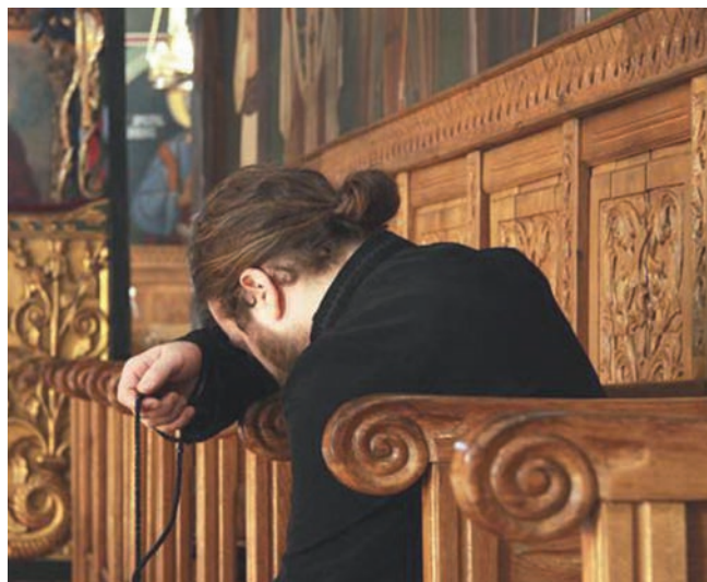
Inima curată și rugăciunea

Pentru a evita intelectualismul platonice, care promova exclusiv mintea – nous în dobândirea contemplației (theoria ca vedere a lui Dumnezeu), părinții filocalici au recurs la conceptul biblic al inimii , gășind motivația chiar în cuvintele Mântuitorului prin care ferește pe cei curați cu inima, ca unii care vor vedea pe Dumnezeu (Mt 5, 8).